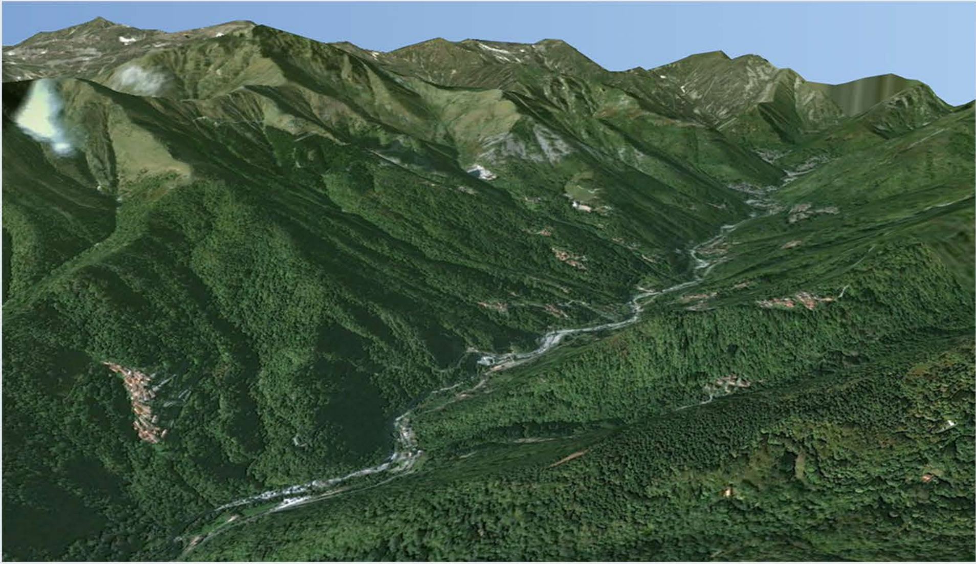
3 - La Valle Cervo, Google Earth Pro.

La Valle Cervo comprende dieci Comuni: Tollegno, Miagliano, Andorno Micca, Tavigliano, Sagliano Micca, Quittengo, San Paolo Cervo, Campiglia Cervo, Rosazza e Piedicavallo. La bassa valle, che si apre dal piccolo abitato di Passobreve (620 m) verso la pianura e la città capoluogo, presenta un aspetto disteso e pianeggiante. La parte superiore della vallata (Piedicavallo, Rosazza, Campiglia, San Paolo Cervo e Quittengo) più spigolosa e aspra, offre segni evidenti dell’azione modellante del manto glaciale. Un tempo la vegetazione era controllata e rada, per creare spazio alle coltivazioni e allo sfalcio dell’erba, necessari alla sopravvivenza delle popolazioni, mentre ora si è spinta a ridosso delle borgate. L’Alta Valle Cervo viene comunemente denominata con un termine che nell’antica parlata locale indicava la casa o piccola patria, “la Bürsch”.