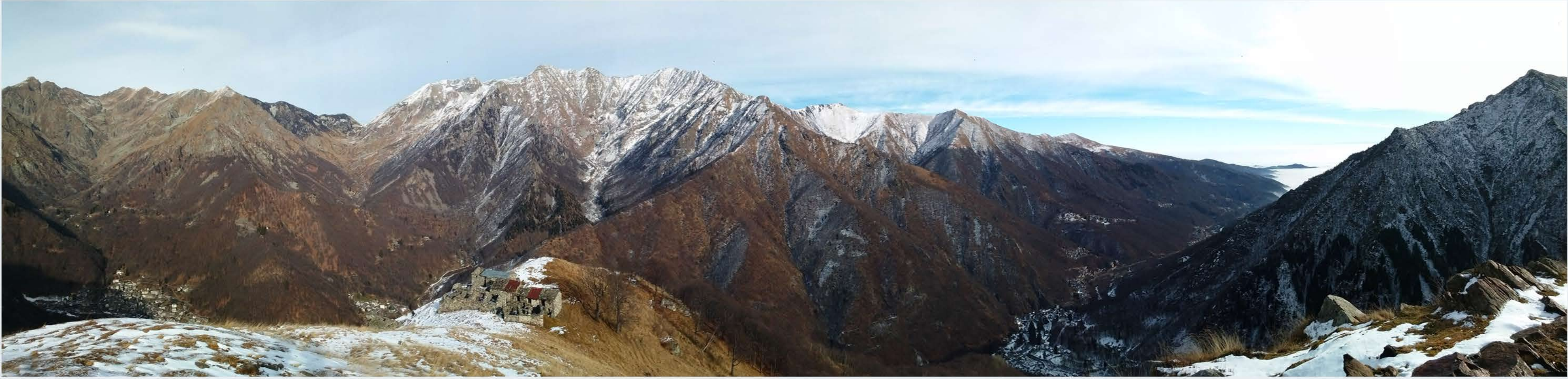
4 - Le cime della banda Soulia dalle Selle di Rosazza, 15 gennaio 2017.

La Valle Cervo comprende dieci Comuni: Tollegno, Miagliano, Andorno Micca, Tavigliano, Sagliano Micca, Quittengo, San Paolo Cervo, Campiglia Cervo, Rosazza e Piedicavallo. La bassa valle, che si apre dal piccolo abitato di Passobreve (620 m) verso la pianura e la città capoluogo, presenta un aspetto disteso e pianeggiante. La parte superiore della vallata (Piedicavallo, Rosazza, Campiglia, San Paolo Cervo e Quittengo) più spigolosa e aspra, offre segni evidenti dell’azione modellante del manto glaciale. Un tempo la vegetazione era controllata e rada, per creare spazio alle coltivazioni e allo sfalcio dell’erba, necessari alla sopravvivenza delle popolazioni, mentre ora si è spinta a ridosso delle borgate. L’Alta Valle Cervo viene comunemente denominata con un termine che nell’antica parlata locale indicava la casa o piccola patria, “la Bürsch”.